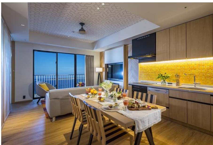
全室オーシャンビューのキッチン&リビングルーム

HGVの新たなリゾートは日本の持続可能な観光をサポートし バケーション・オーナーの国内旅行を促進します