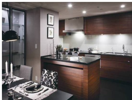
<キッチン&ダイニングルーム>