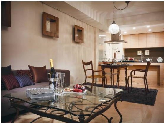
<リビング & ダイニングルーム>