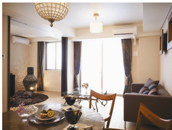
<リビング & ダイニングルーム>