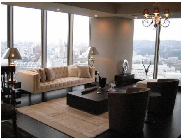
〈モデルルーム内写真 130Cタイプ リビング〉