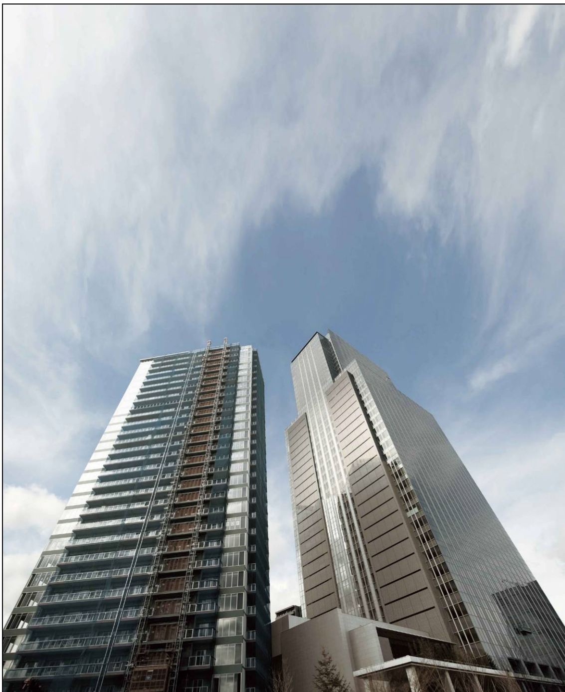
「SENDAI TRUST CITY(仙台トラストシティ)」現地見上げ写真 (2010年2月撮影) 左「ザ・レジデンス一番町」、右「仙台トラストタワー」