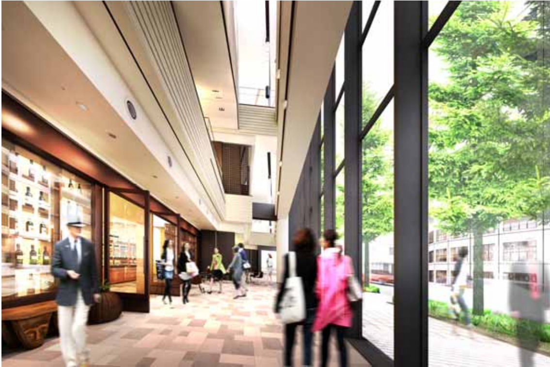
1階インテリアイメージ