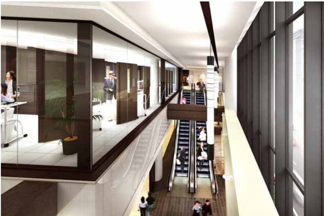
3階インテリアイメージ