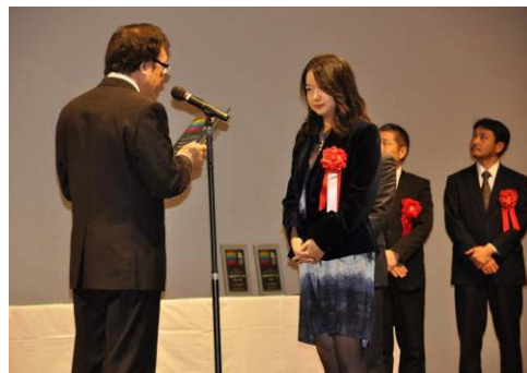
12月12日に行われた表彰式

デザインの耐久性も飽きのこない大人好みであるゆえ、審査員一同の意見が一致し、大賞としてその価値をたたえることとした。