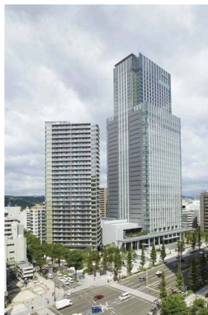
『仙台トラストシティ』 右:仙台トラストタワー 左:ザ・レジデンス一番町

さらに、「ウェスティンホテル仙台」のデザインは、幾様もの系譜がある仙台の文化の中で最もモダンであった伊達の文化と舶来の文化芸術との融合をコンセプトに構成しており、黒と金に代表される伊達の色彩など伝統的なモチーフが随所に活かされながら、コンテポラリーなインテリア空間に調和しています。