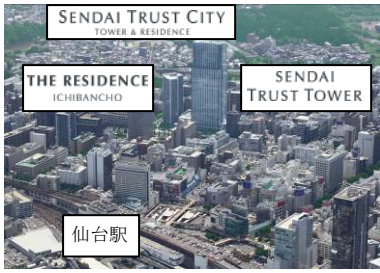
仙台トラストシティ俯瞰