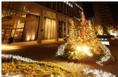
ウィンターイルミネーションの様子