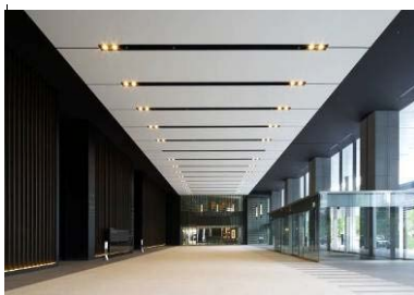
オフィスエントランス