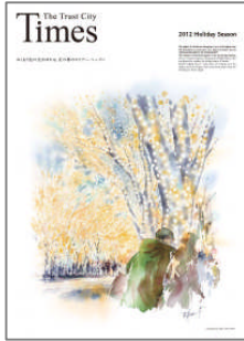
『2012 Holiday Season』号

古山拓氏（『2011 AUTUMN』号から『2013 SUMMER』号まで表紙制作を担当）による表紙デザイン