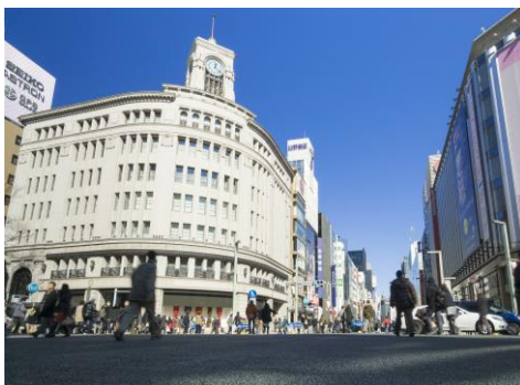
日本を代表する商業地「銀座」

森トラストグループは、2016年から2018年にかけて、約160億円を投じる既存ホテル7施設約1000室のリノベーション計画を推進し、2019年以降は、虎ノ門(虎ノ門トラストシティワールドゲート内)、箱根、沖縄、白馬、奈良にて、国際基準ホテルの新規開発を計画しております。ホテルディベロッパーとして次のステージを目指すと共に、世界の成長産業である観光産業に多面的な角度から積極的に取り組むことを通じて、社会に貢献してまいります。