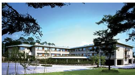
『ラフォーレ倶楽部 ホテル中軽井沢』 （長野県軽井沢町）