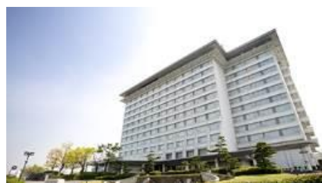
『総合リゾートホテル ラフォーレ琵琶湖』 （滋賀県守山市）