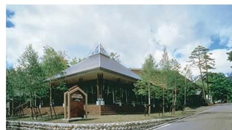
『ラフォーレ倶楽部 ホテル白馬八方』 （長野県白馬村）