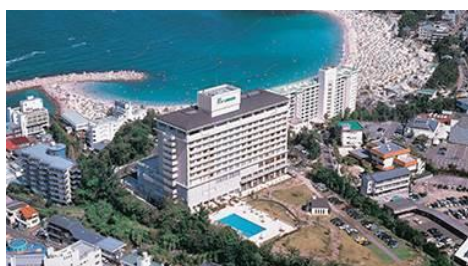
『リゾートホテル ラフォーレ南紀白浜』 （和歌山県白浜町）