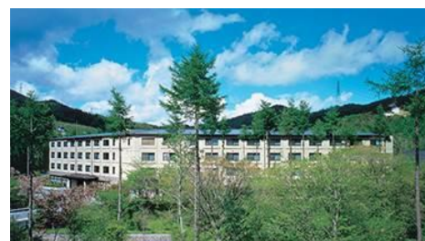
『リゾートホテル ラフォーレ山中湖』 （山梨県山中湖村）