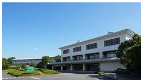
『総合リゾートホテル ラフォーレ修善寺（ホテル棟）』 （静岡県伊豆市）