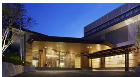
『ラフォーレ倶楽部 伊東温泉 湯の庭（第2期）』 （静岡県伊東市）