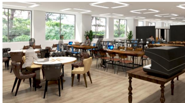
コワーキングスペース（イメージ）