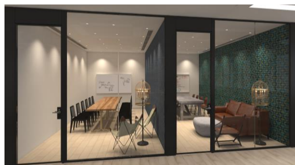
ミーティングルーム（イメージ）

会員であれば誰でも利用可能な予約制のミーティングスペース。10 人席から 18 人席まで、目的に応じてそれぞれ個性を持たせたデザインの部屋を選択することができ、快適かつ創造性が刺激されるミーティングを行うことができます。