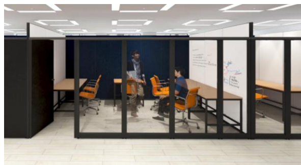
プライベートオフィス（イメージ）

契約者専用の施錠可能なプライベートオフィススペース。2 人席から 6 人席までの様々なバリエーションを用意しており、企業・チーム規模に合わせたサイズのオフィスを選択することができます。