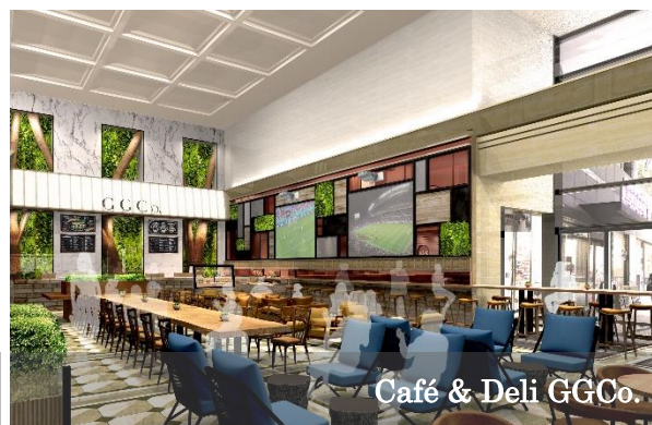
Café & Deli GGCo