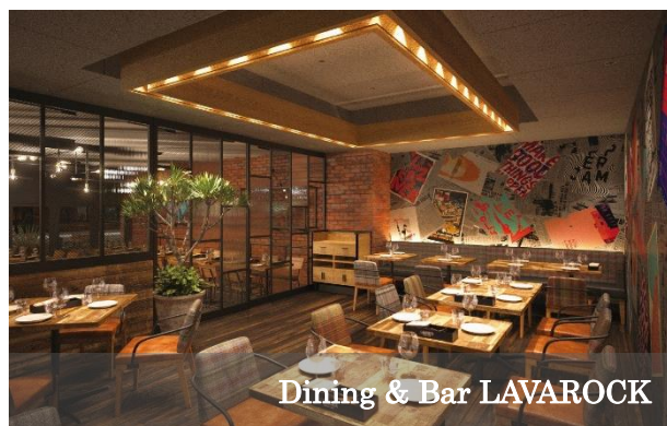
Dining & Bar LAVAROCK