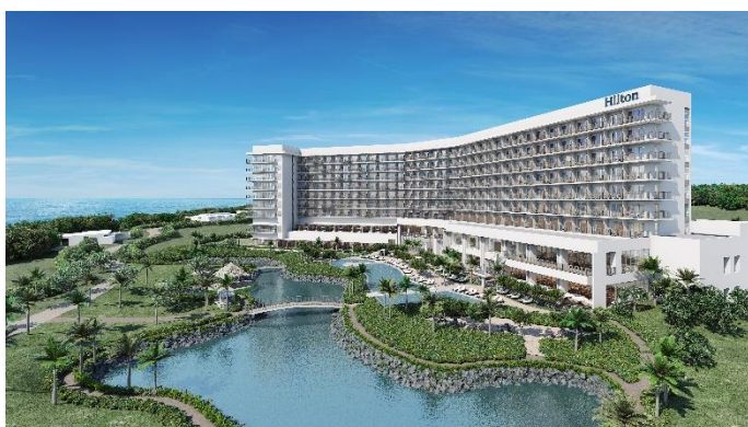
ヒルトン沖縄瀬底リゾート 外観 イメージ