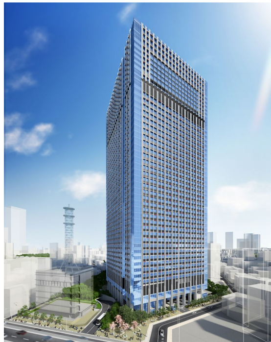
建物外観イメージ

また、当プロジェクトは2021年2月12日に民間都市再生事業計画として、国土交通大臣による認定を受けました。