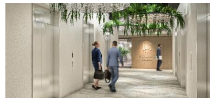
顧客企業独自のデザインが可能な共用部 ※記載のバースは全てイメージです。