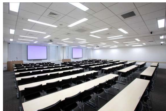
Room 3+4 (スクール形式 138 名収容)