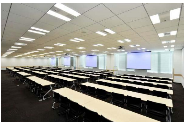
Room 2+3+4+5 (スクール形式 204名収容)