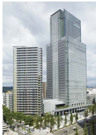
仙台トラストシティ外観