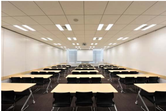
Room 5 (スクール形式 51 名収容)

ご利用のお申込みは電話だけでなく、「トラストシティ カンファレンス・仙台」のホームページ上でも行うことができます。ご希望のレイアウトへの対応、急なご要望、備品等のお取扱方法に対してスタッフがお客様をサポートし、速やかに対応いたします。また、「トラストシティプラザ」のバリエーション豊かな店舗との様々な提携サービスを予定しており、多方面から会議をサポートいたします。