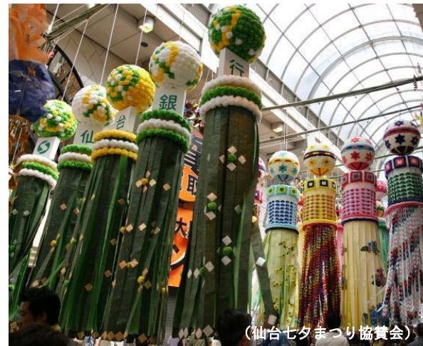
(仙台七夕まつり協賛会)