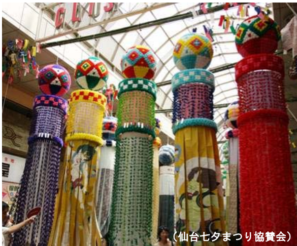
(仙台七夕まつり協賛会)

今後も森トラストグループでは、東北をもりあげていけるようグループを挙げて、仙台や首都圏をはじめとした全国の関連施設において、東北の観光情報の発信やグループホテルにおける特別プランの提供など様々な取り組みを行ってまいります。