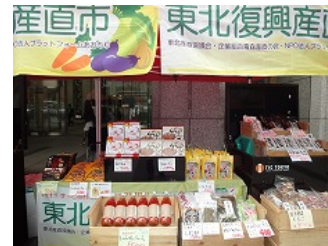
<東北産直協議会の産直品販売>