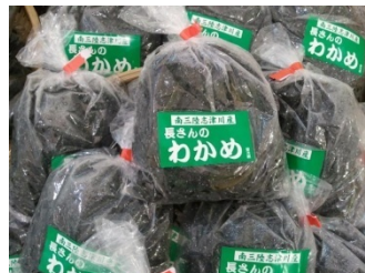
<南三陸町の塩蔵わかめ>