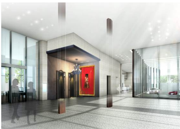
ホテルエントランスイメージ