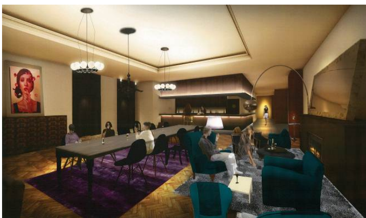
ホテルラウンジイメージ