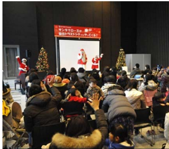
サンタクロースと子ども達