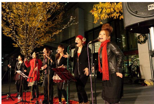
the voice of LOVE 生ライブ

また、仙台市のキャンドル&インテリアショップ「Lamp of Hope」の協力によるキャンドルナイトも同時開催します。やさしいキャンドルの灯りで、ご来場いただいた皆様に癒しと安らぎをお届けします。