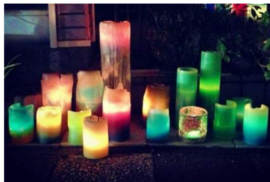
キャンドルナイト