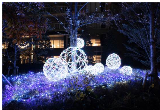
「カラーボールのイルミネーションオブジェ」