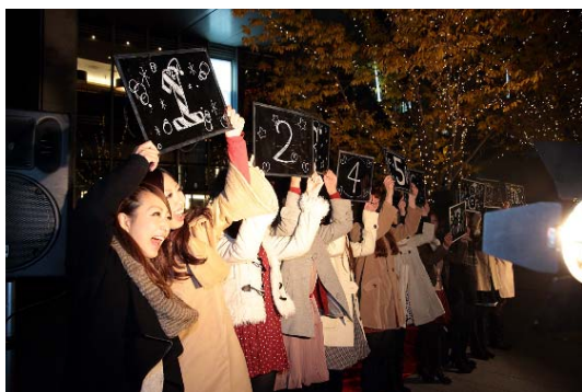
仙台美人時計モデルによるカウントダウン