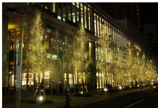
「シャンパンゴールドのイルミネーションロード」