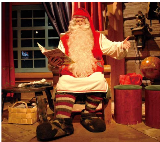
フィンランドからのサンタクロース

昨年は(株)わかさ生活東北支社の開所もあり、サンタクロースが宮城県を訪れ、たくさんの方々に笑顔を届けることができました。また昨年までの取り組みを通じて、これまでに14,500人の方々との交流を重ねています。