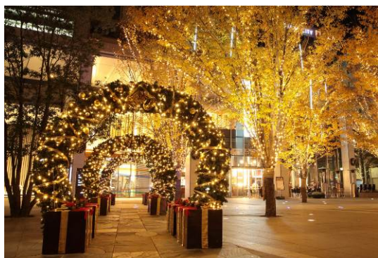
「シャンパンゴールドのイルミネーションと光のアーチ」

また本年度より新たに、トラストシティプラザ柳町通側の街路樹にもLED電球を取り付け、「 シャンパンゴールドのイルミネーションロード 」を新設します。これにより電球数は過去最大の約5万球となり、例年以上のスケールで、仙台トラストシティの街区全体を暖かな光で包み込みます。