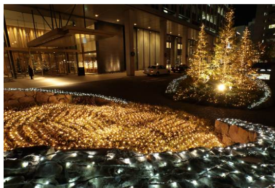
「ホワイต์&ゴールドのサークルイルミネーション」