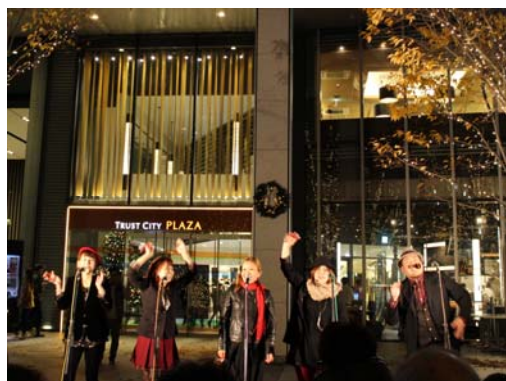
the voice of LOVE 生演奏

※Lamp of Hopeは、2012年3月11日に宮城県塩竈市にて「追悼キャンドルナイト」や、2014年3月11日に『仙台トラストシティ』にて「3.11 希望のひかり キャンドルナイト in 仙台トラストシティ」を開催している、仙台市青葉区のキャンドル&インテリアショップです