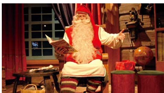
フィンランドからのサンタクロース

2012年6月に(株)わかさ生活東北支社が開所したことなどをきっかけに、サンタクロースの宮城県への訪問も開始され、たくさんの子供たちに笑顔をお届けことができました。昨年までの取り組みを通じて、これまでに28,000人もの方々との交流を重ねています。