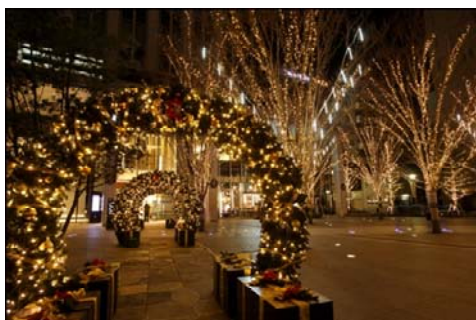
シャンパンゴールドのイルミネーションと光のアーチ 『トラストシティプラザ』前広場