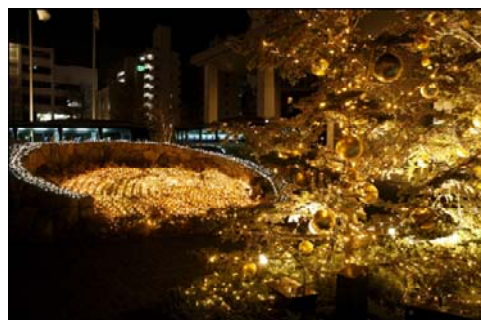
ホワイト&ゴールドのサークルイルミネーション 『ウェスティンホテル仙台』前