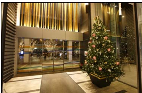
ウェルカムクリスマスツリー 『トラストシティプラザ』エントランス