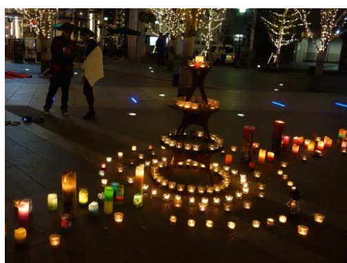
キャンドルナイト