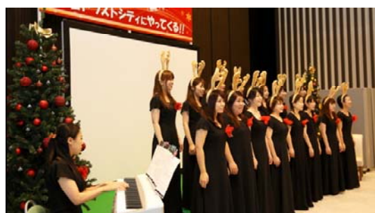
イベント当日の様子