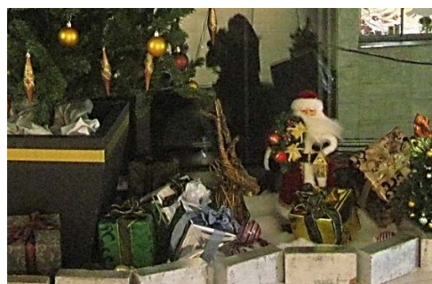
サンタクロースのミニチュアオブジェ 『トラストシティプラザ』2階・3階ツリー前