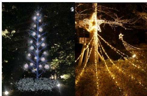
カラーボールのイルミネーションツリー 他 『ザ・レジデンス一番町』前広場