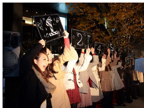
仙台美人時計モデルによるカウントダウン