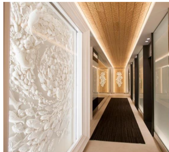
1階エレベーターホール