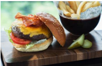
マリオットバーガー・マリオットクリームソーダ

東京マリオットホテルより「マリオットバーガー」やハーゲンダッツバニラアイスクリームを使用した「マリオットクリームソーダ」が特設ブースにて提供されるほか、ピザやローストビーフ、モチコチキンなどのキッチンカーが並び、多彩なメニューでお花見気分を盛り上げます。