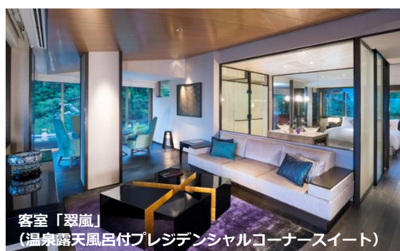
客室「翠嵐」 (温泉露天風呂付プレジデンシャルコーナースイート)