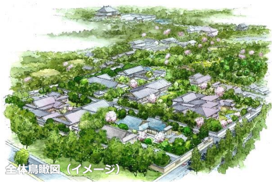
全体鳥瞰図 (イメージ)

当社は、世界的な建築家である隈研吾氏の協力のもと、この地の歴史や自然、古都・奈良の素晴らしさを世界に発信すべく、歴史的建造物や緑豊かな周辺エリアとの融合を図りながら再構築を行い、最高級インターナショナルホテルを中心とした施設開業を目指しています。