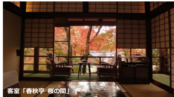
客室「春秋亭 桜の間」

森トラスト株式会社（本社：東京都港区 社長：伊達 美和子）は、2017年3月13日付で、箱根町強羅の高級老舗旅館『強羅環翠楼』 ごうらかんすいろ （以下、本旅館）を取得しましたので、お知らせいたします。