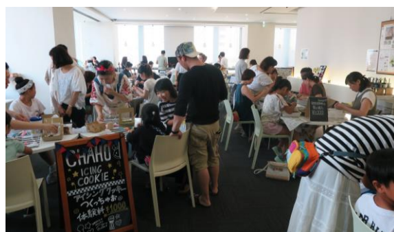
※写真はすべてイメージです