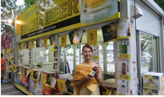
※前回までのイベントの様子