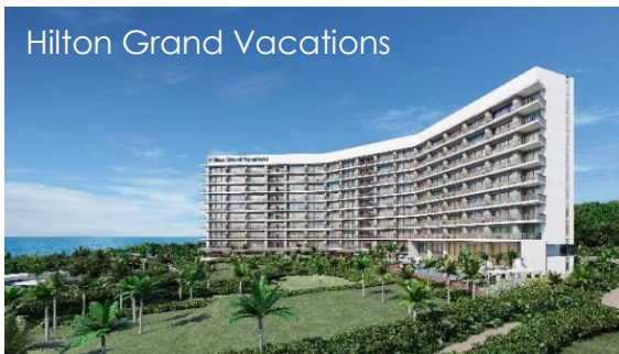
Hilton Grand Vacations