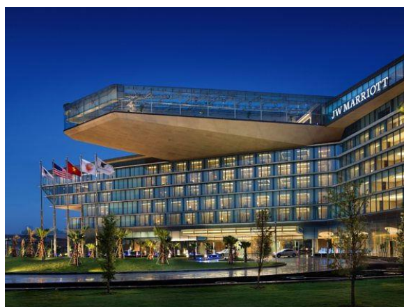
JWマリオット・ホテル・ハノイ