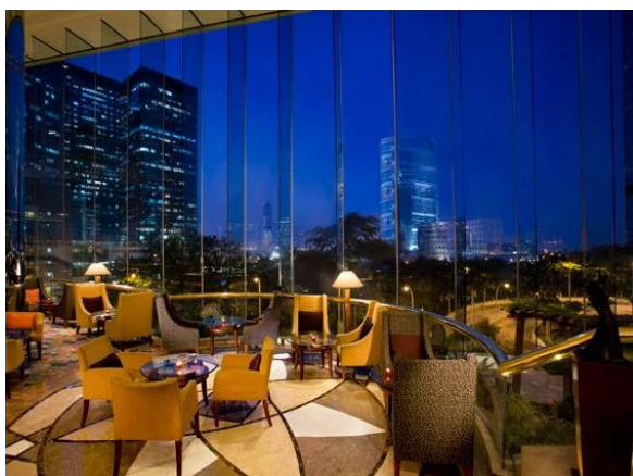
JWマリオット・ホテル香港