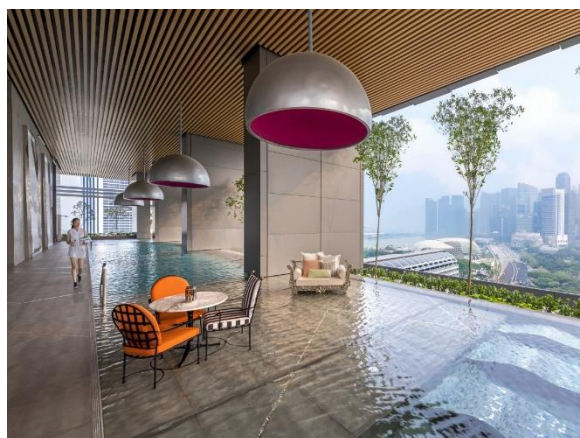
JWマリオット・ホテル・シンガポール・サウスビーチ