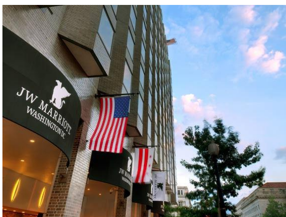
JWマリオット・ワシントンDC

現在、約30の国と地域に80軒を擁するJWマリオットは、旅行業界で数々の賞を受賞しているロイヤリティ・プログラムであるマリオット・リワード®（ザ・リッツ・カールトンリワード®を含む）に参加しております。会員の方は、members.marriott.com でスターウッド プリファードゲスト®とアカウントをリンクでき、エリートステータスのマッチングや無制限のポイント移行を即座に行うことができます。JWマリオットの最新情報は、ウェブサイト(www.jwmarriott.com)、インスタグラム(@jwmarriotthotels)、ツイッター(@JWMarriott)、フェイスブック (@JWMarriott)をご覧ください。