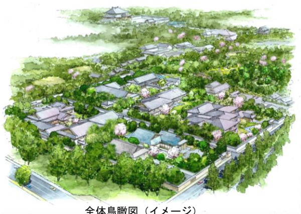
全体鳥瞰図（イメージ）