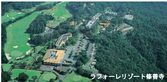
ラフォーレリゾート修善寺