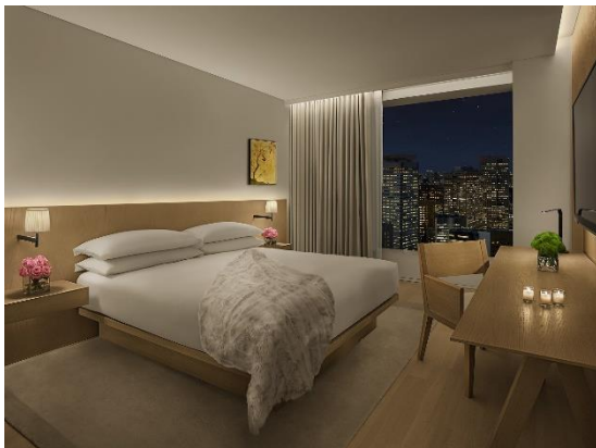
キングデラックスルーム

「エディション」はニューヨークを拠点に様々なライフスタイルホテルを誕生させたイアン・シュレガーと、マリオット・インターナショナルのコラボレーションにより誕生した新世代のラグジュアリーライフスタイルホテルです。独特な空間と個性的なサービススタイルは世界中のセレブリティに愛され、世界9都市で展開されています。日本初上陸となる「東京エディション虎ノ門」は、高層階のテラス付客室を含む、206室の客室すべてから東京のスカイラインを一望でき、世界最新のグルメをお楽しみいただけるモダンな空間のレストランやバーからは、東京湾や東京タワーの煌めく絶景ビューをご堪能いただけます。