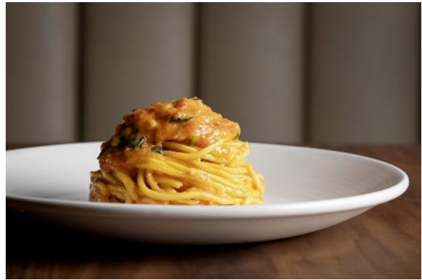
「Scarpetta」で人気のトマトとバジルのスパゲッティ