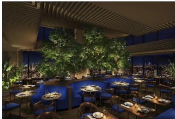
レストラン「The Blue Room」