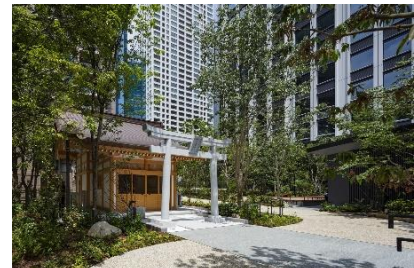
1階 外構・葺城稲荷神社