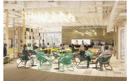
2階 ラウンジ・カンファレンス