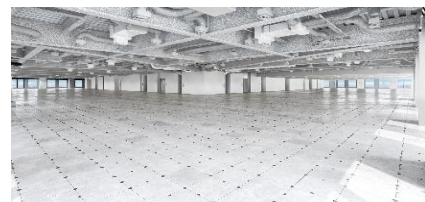
「クリエイティブフロア」の内装引渡し基準