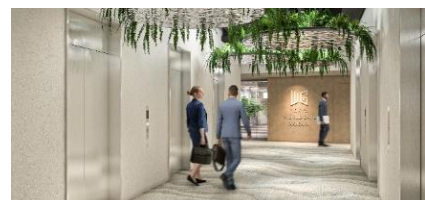
顧客企業独自のデザインが可能な共用部 ※記載のイメージは全てイメージです。