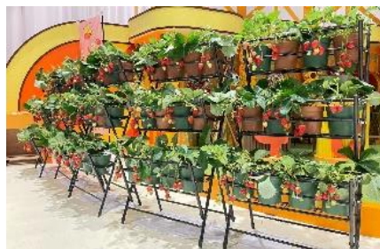
いちご狩り会場イメージ