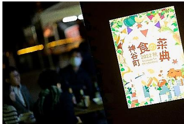
昨秋開催時の様子