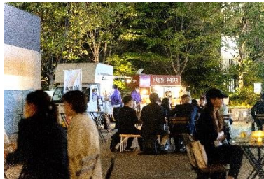
昨秋開催時の様子