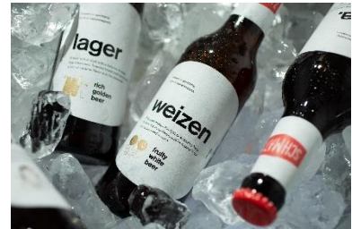
提供飲料イメージ