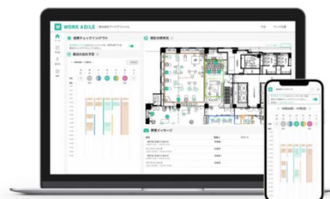
▲「WORK AGILE」使用画面(イメージ)

本社、支社、在宅、休暇、サードプレイスなど、社員の居場所を検索できる把握機能や、チーム予約・ランダム予約といったワーカークラスが快適な場所で働くための多様な予約機能など、社員が集まりやすい仕組みでリアルでのコミュニケーションを誘発します。