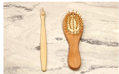
竹製歯ブラシと木製ヘアブラシ