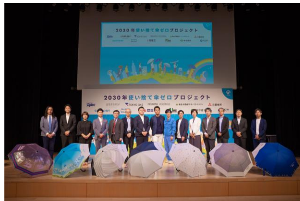
2023年6月8日 記者発表会の様子