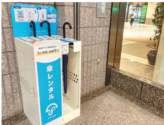
アイカサスポット設置場所(城山トラストタワー)

今後、当社が運営する複数ビルへのアイカサスポットの設置拡大を予定しており、株式会社 Nature Innovation Group と連携して駅とオフィスビルを「アイカサ」で繋げ、雨の日に欠かせないインフラ整備および傘のシェアリングサービスによる循環型経済の実現に寄与してまいります。