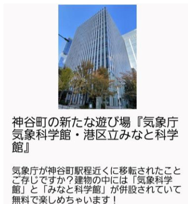
施設・店舗紹介イメージ