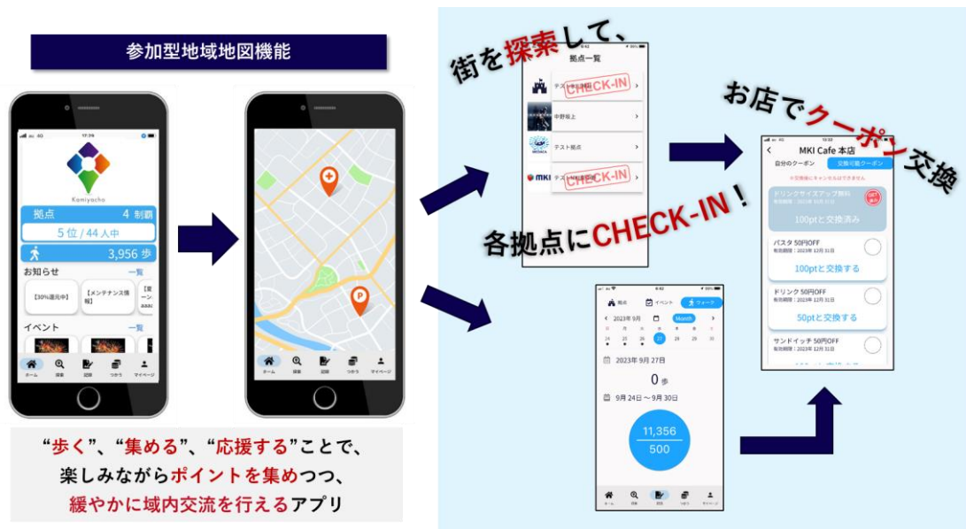
MIALK 神谷町 イメージ

街を巡りながら画像やコメントを地図上に投稿し、ユーザー同士で情報交換やコミュニケーションを取ることができます。