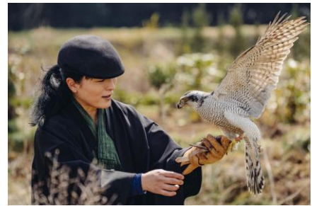
▲「諏訪流放鷹術」実演イメージ