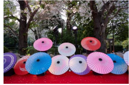
▲「御殿山桜ノ下演芸場」イメージ