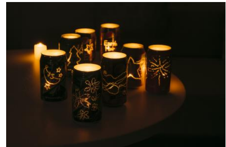
▲点灯する手作りのランタン(一部)

※販売商品の詳細は2/22(木)以降、 https://www.tokyo-marriott.com/event/ をご参照ください。