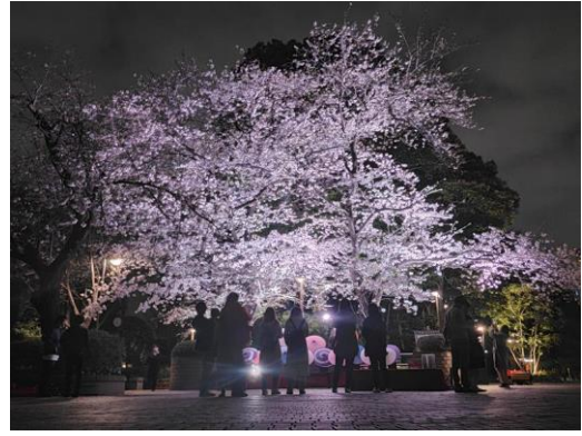
▲御殿山さくらまつりの様子(2023年撮影)