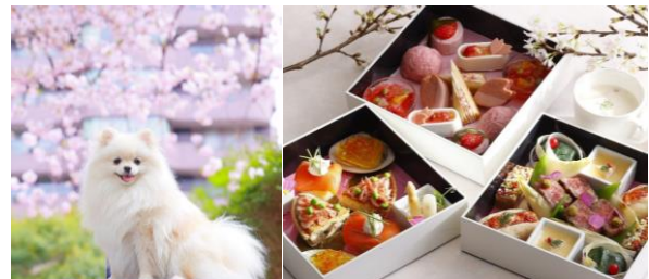
▲「Sakura Shooting with Dog 2024」イメージ

東京マリオットホテル1階レストラン「Lounge & Dining G」の御殿山テラスにて、愛犬とともに、春ならではの食材を使ったシェフオリジナルの「GOTENYAMA SAKURA BOX」のテラスランチと、フォトグラファーによる撮影付きのお散歩をお楽しみいただける1日限定イベントです。