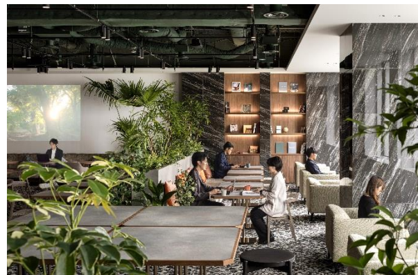
バイオフィリックデザインを採用したオフィス空間