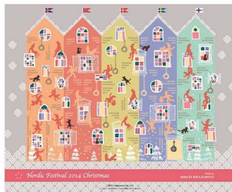
※シールデザイン (1シート50片分)

日 程 : 11月28日(金)~12月25日(木) 時 間 : 全日 (シール販売 10:00~20:00) 場 所 : 『東京マリオットホテル』フロント クリスマスワゴン