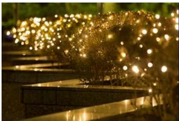
エントランスイルミネーション