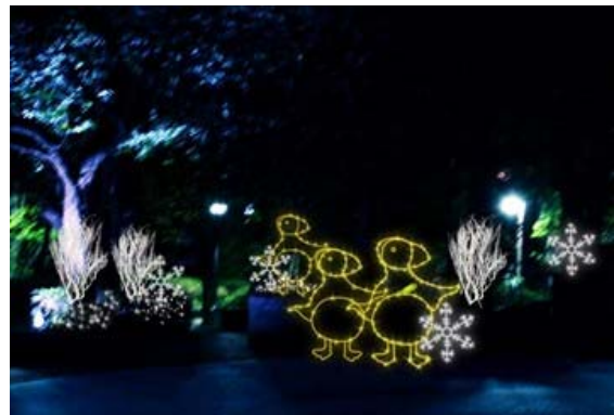
氷の国のイルミネーション