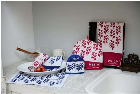
HELMi nordic line

『東京マリオットホテル』内にて、アイスランドをはじめとした北欧のおしゃれな小物やアイスランドで愛される海鳥「パフィン」のぬいぐるみなどをワゴン販売します。北欧で有名な「HELMi nordic line」のベリーをデザインしたシリーズや、火山灰で色付けされた希望の鳥「LOA」、海鳥「パフィン」のグッズなど、珍しい雑貨が並びます。さらに、アイスランド航空のキャンペーンも開催し、魅力的なアイスランドの旅をご紹介します。