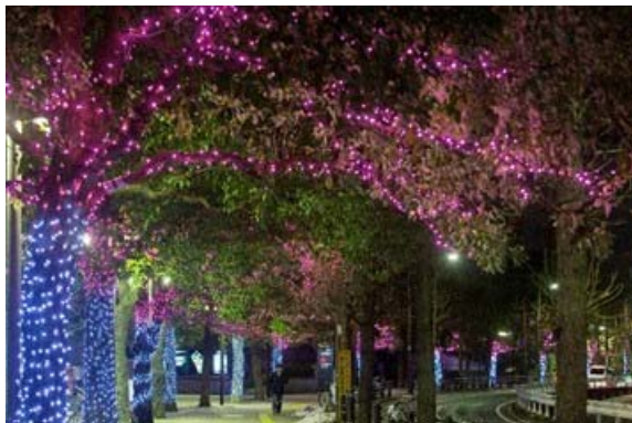
桜のイルミネーション

また、新たに『東京マリオットホテル』前広場では、アイスランド・氷の国をイメージしたイルミネーションを展開します。広場の中心にはアイスランドで愛される海鳥「パフィン」の光るモチーフを配置したフォトスポットも登場します。『東京マリオットホテル』内では、アイスランドの神秘的なオーロラをモチーフにしたクリスマスツリーを設置します。