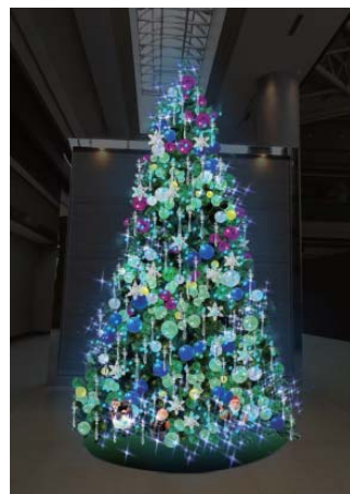
オーロラクリスマスツリー