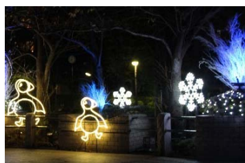
アイランド・クリスマス in 御殿山トラストシティ