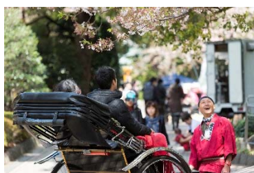
御殿山さくらまつり