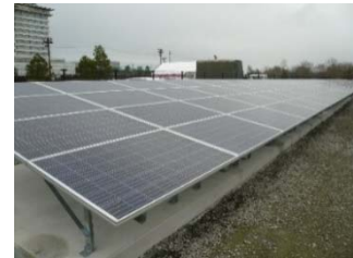
森トラスト・エネルギーパーク琵琶湖

再生可能エネルギーの導入・促進と、地域・社会貢献を目的としているメガソーラー(大規模太陽光発電)事業について、『森トラスト・エネルギーパーク泉崎』(福島県西白川郡泉崎村)の第2期事業が着工しました。また、建設を進めておりました『森トラスト・エネルギーパーク琵琶湖』(滋賀県守山市)については2014年12月に竣工し稼働を開始しました。森トラストグループでは、2013年8月より『森トラスト・エネルギーパーク泉崎』の第1期事業を稼働させており、上記事業はこれに続くものとなります。今後もグループ各社の経営資源・ノウハウを活用し、都市と地方の持続的発展に資する取り組みを継続してまいります。