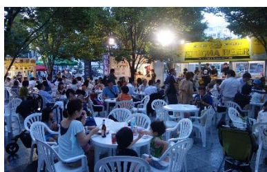
東北×タイフェスタ