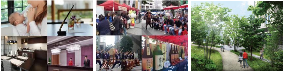
外国人の生活サポート機能の導入