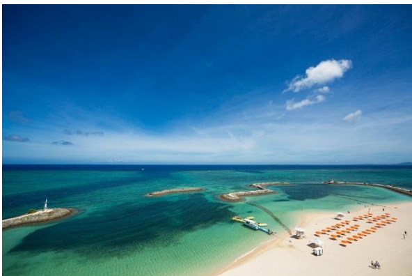
サンマリーナビーチ

美しい白浜ビーチに面した、全客室バルコニー付オーシャンビューのリゾートホテル「シェラトン沖縄サンマリーナリゾート」は沖縄本島で唯一となるマリーナ付属のホテルであり、2016 年 6 月には大規模リノベーションを行うとともに、マリオット・インターナショナルのクラシックプレミアムブランドである「シェラトン」にリブランドしました。2016 年 12 月には新ホテル棟、2017 年春にはチャペルやウェルネス施設もオープンし、今後さらに敷地内において新たな開発計画も検討しています。