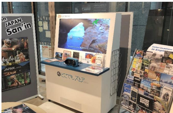
どこでもストア (サイネージ型)