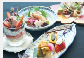
夕膳コース「門出」 メニューイメージ

鱈や鯛、山菜、ミガキイチゴなど厳選された旬の食材をシェフが丁寧に仕上げご提供する、春の息吹を随所に感じる贅沢なディナーコースです。