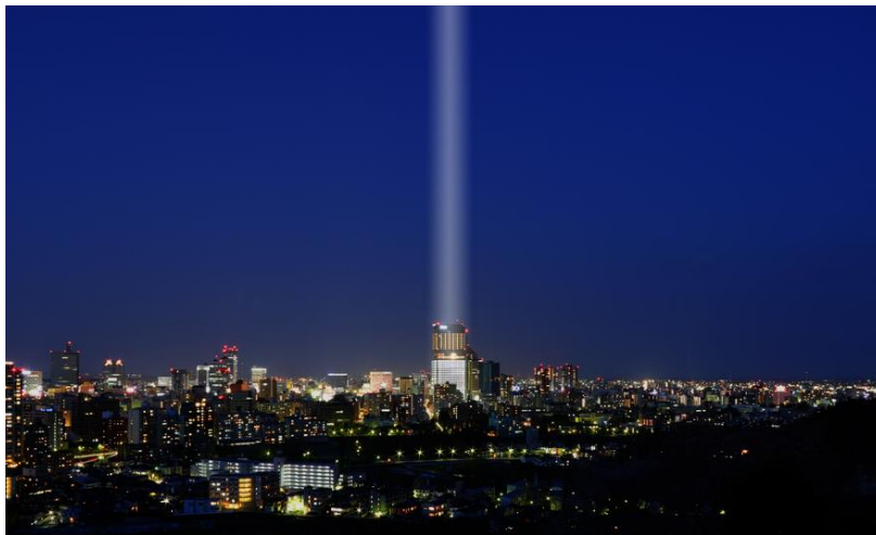
「3.11 希望の光」ライトアップイメージ

仙台トラストシティのプラザ前広場から大型照明 8 基 32 灯のライトをまっすぐ天へと伸ばし「希望の光」を立ち上げます。宮城県に事業所を構える企業 44 社のご協力のもとに地域一体となり、震災からの 10 年を振り返り、また未来に想いを馳せるきっかけを創出いたします。遠方やご自宅からご覧いただける強い光となっておりますので、それぞれの場所で想いをお寄せください。