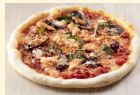
三陸産海の幸のピザ ペスカトーレ

三陸産のタコや帆立貝をはじめ、海の幸をふんだんに使いトマトの甘味を活かしたソースと組み合わせたピザです。